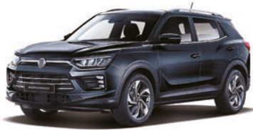
SPACE čierna (LAK)