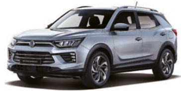
IRON kovová (ADE)