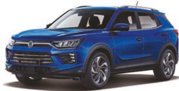
DANDY modrá (BAS)