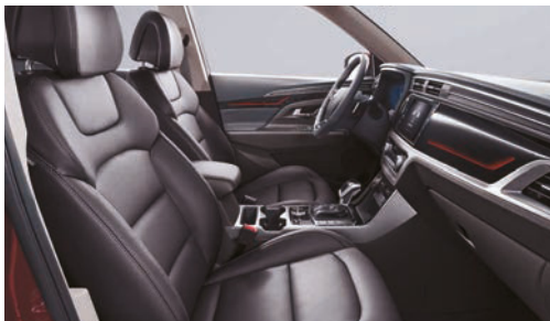
Čierna interiér (LBH)