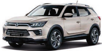
LATTE béžová (EBL)