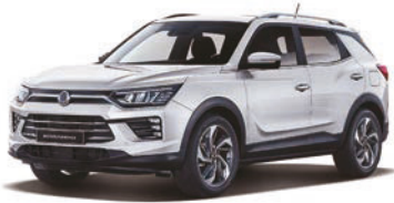
GRAND biela (WAA)