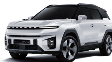
GRAND biela s čiernou strechou (2WA)