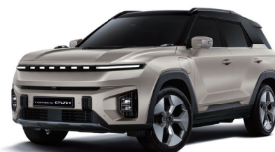
LATTE béžová s čiernou strechou (2BL)