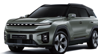
FOREST zelená s čiernou strechou (2GO)