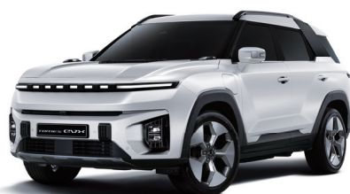
GRAND biela (WAA)