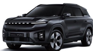
SPACE čierna (LAK)