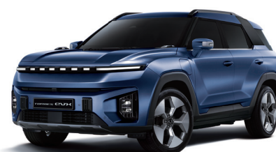
DANDY modrá (BAS)