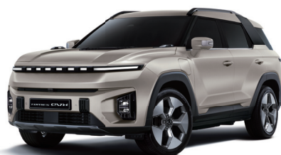
LATTE béžová (EBL)