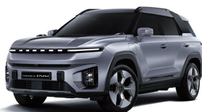
IRON kovová (ADE)